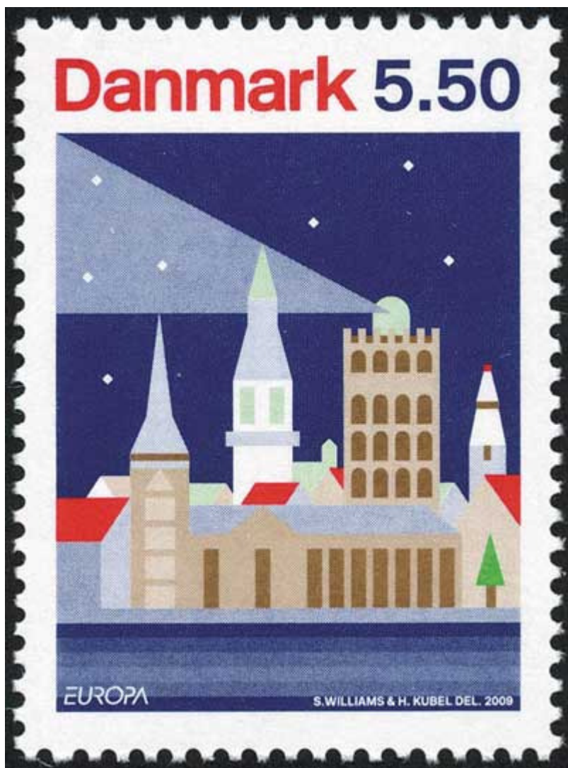
Frimærkekunst år 2009