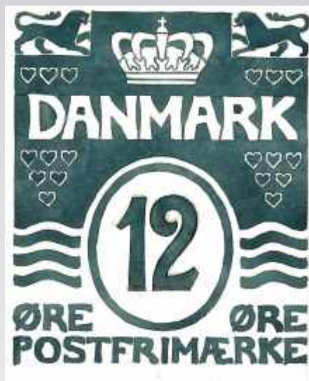
Ændret design 1926 (tilhører Enigma)

Grundmærket er det samme som det kurserende frimærke, men fordelingen af hjerterne er anderledes. Ideen med det nye design blev opgivet.