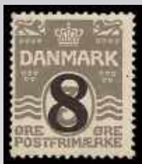
Provisorie - 8 øre på 3 øre

Bølgelinjefrimærket i bogtryk blev også brugt som portomærker med overtrykket "PORTO" og som postfærgemærker med overtrykket "POSTFÆRGE".