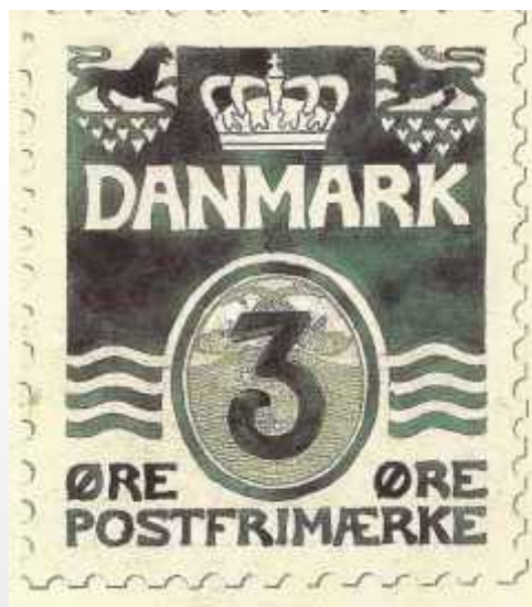
Figur 16. Forskellige udkast til 1905 udgaven