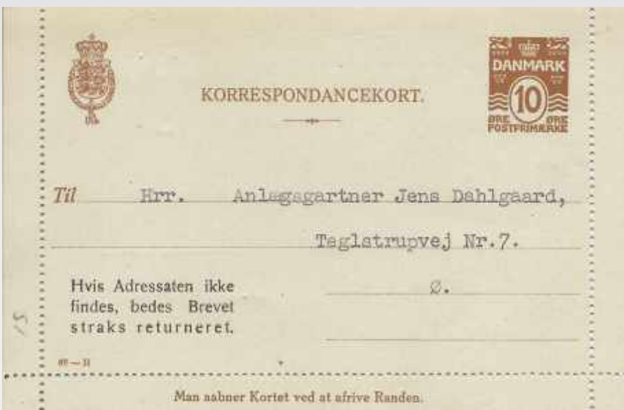
Bølgelinjefrimærke på helsager: konvolut, korsbånd, korrespondancekort, enkelt og dobbelt brevkort