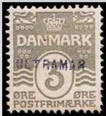
Specimen fra den portugisiske koloni Angola (ultramar betyder oversøisk)

Ved Verdenspostunionens (U.P.U.) anden kongres i 1878 blev det besluttet at hvert medlemsland skulle sende dets nye frimærker til andre medlemslande. Hvis landet havde kolonier blev der også sendt frimærker til dem. For at frimærkerne ikke kunne bruges ved evt. tyveri blev de overstemplet (specimen). Overstemplingen er foretaget af Angola, Protektoratet Bechuanaland, Madagascar, Mauritanien og Natal.