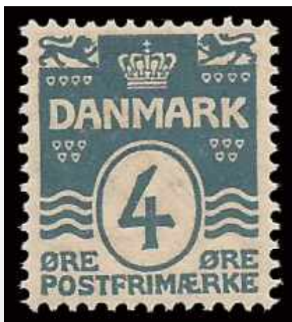
Den færdige tegning (tilhører Enigma) og det første bølgelinjefrimærke