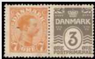
Automatfrimærker par – lodret og vandret