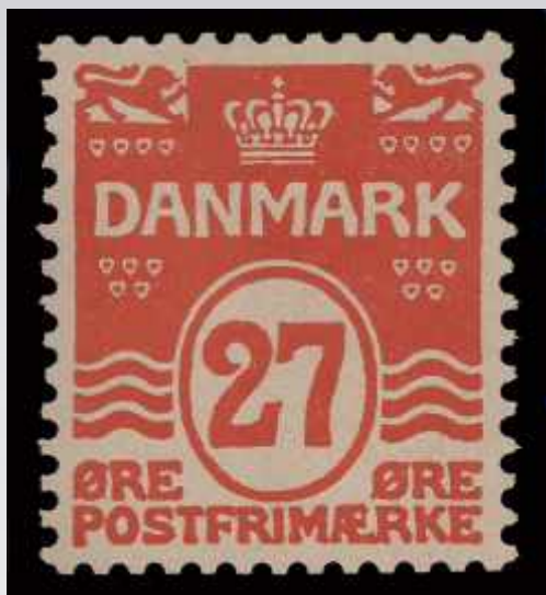
Udgivet 27-øres frimærke

I 1926 påtænkte man en modernisering af Therschilsens design.