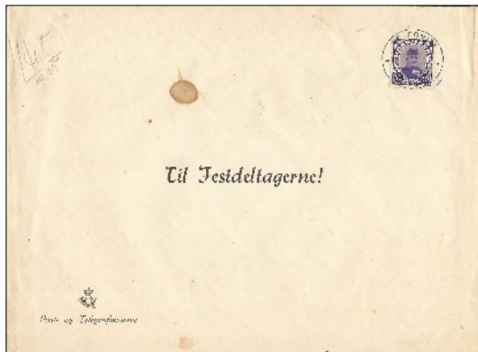
Brev med indlagte sange, menukort m.m.

Værdiangivelsen er ændret til "AAR". Frimærket er trykt som en firblok i et miniark. Der findes også et utakket frimærke i rødt.